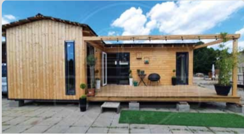
WILKOWYJE 35m 2