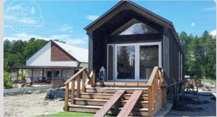
MRAĞOWO 35m 2