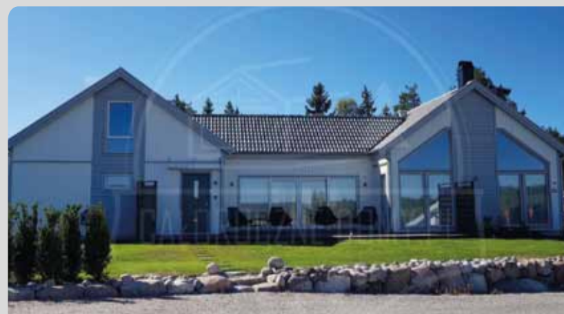
SPOKÓJ 80m 2