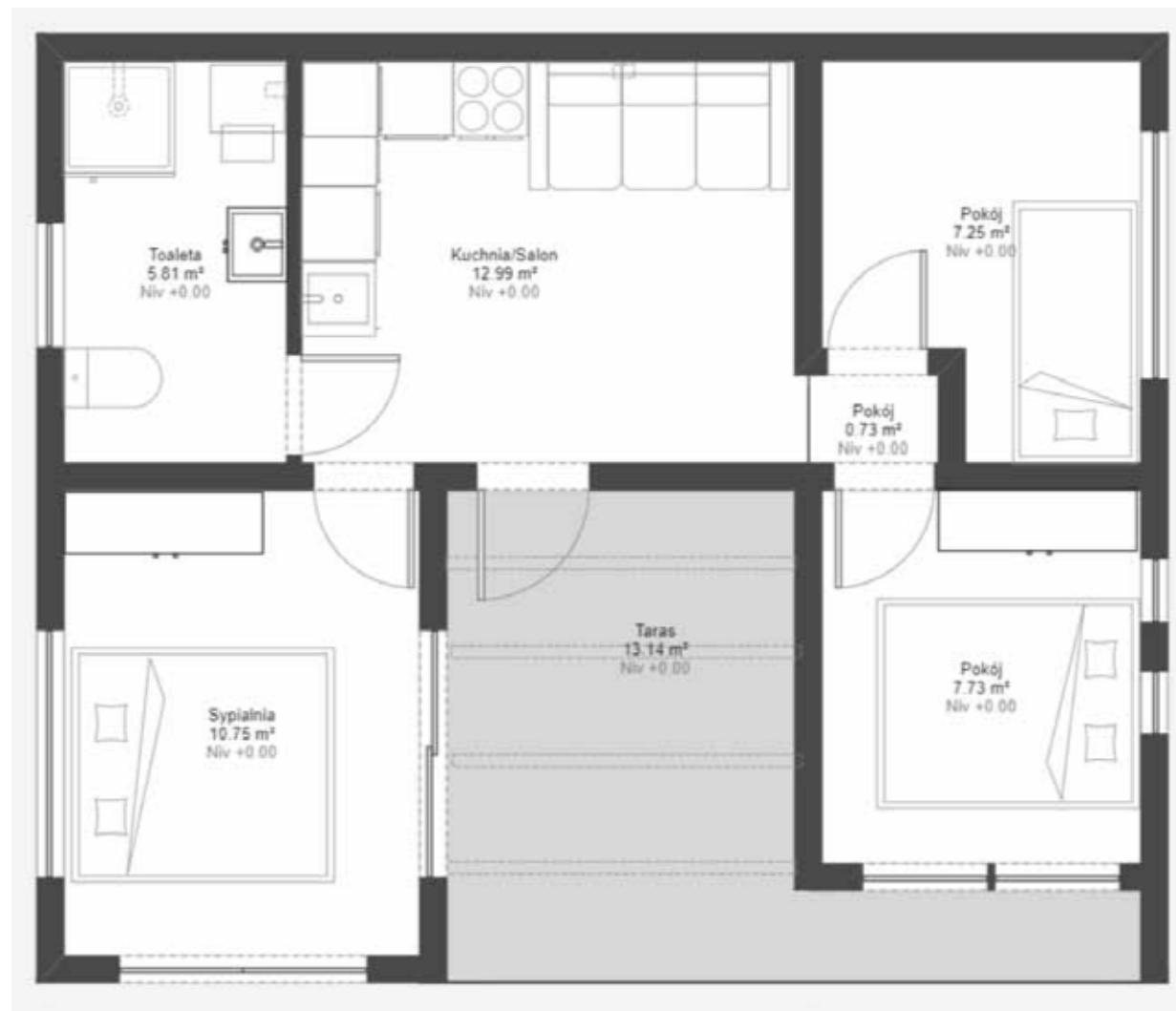
Plan - wersja rozbudowana Ilość sypialni: 3