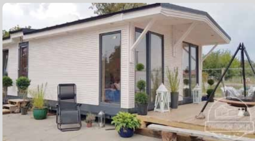
PORANEK 50m 2