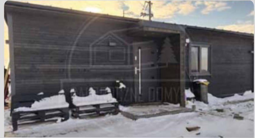
WILLA BOR 50m 2