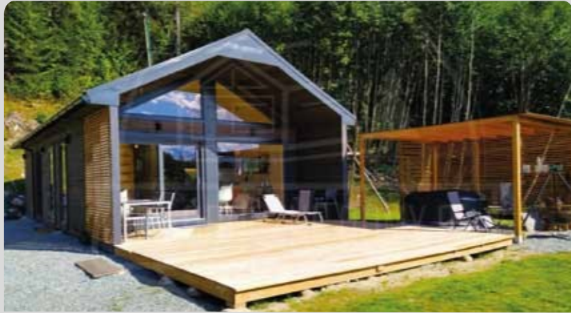
TINA 60 m 2