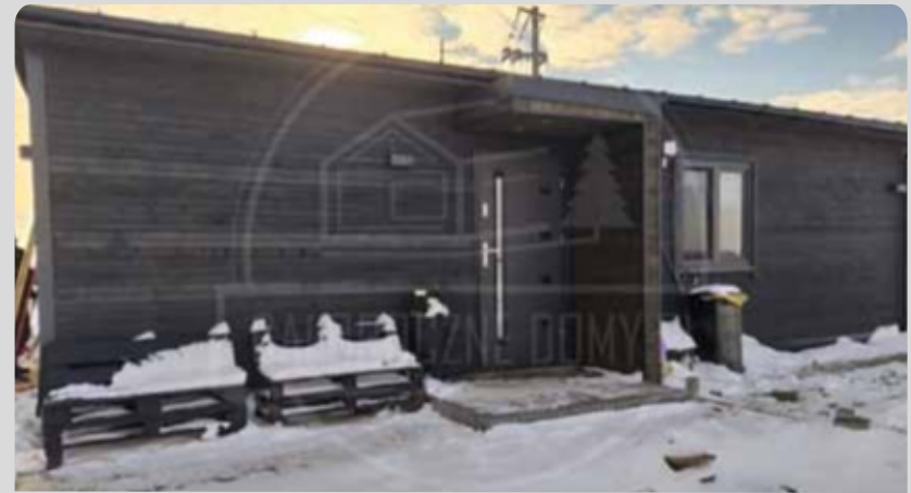
WILLA BOR 50m 2