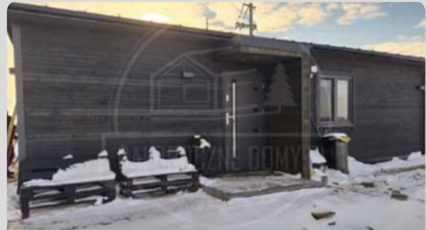
WILLA BOR 50m 2