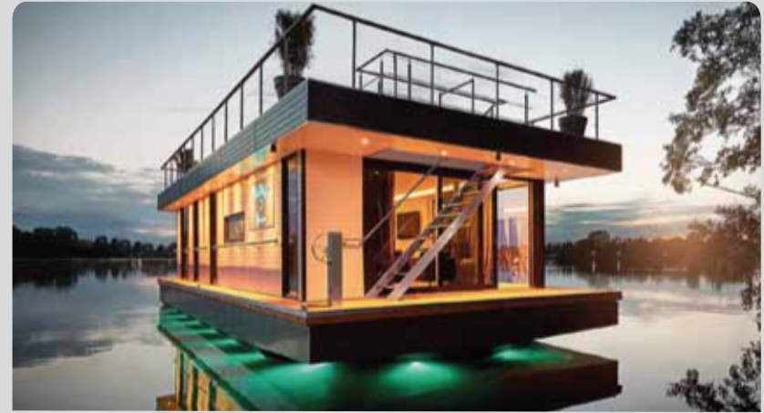
DOM NA WODZIE 40-62 m 2